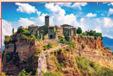
チヴィタ・ディ・バーニョレージョイメージ