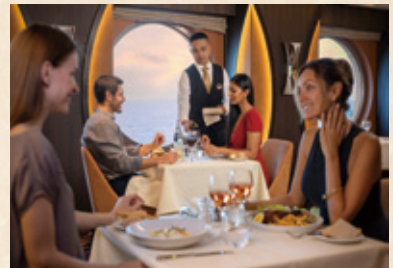
船内レストランイメージ

※イーゼードリンクパッケージは有料となるメニューがございます ※有料レストランを除く ※客室内ミニバーを除く