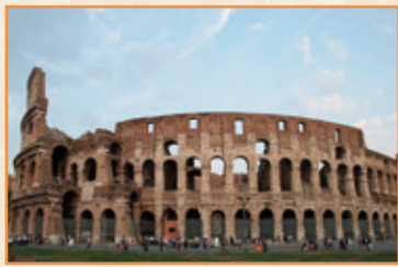
コロッセオイメージ

基本コースのみ ●関空発着コース●名古屋から関空まで専用車送迎付きコース もあります!(旅行代金は東京発着と同額)