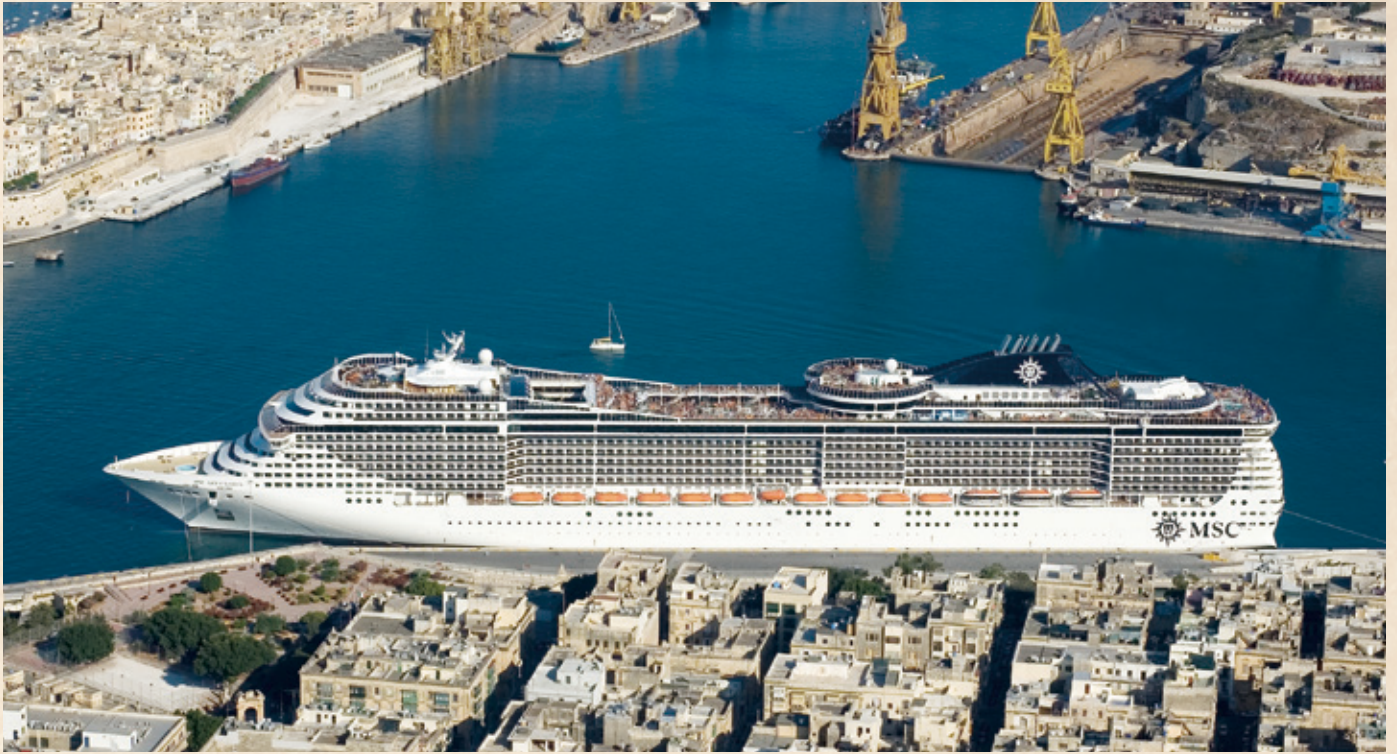
マルタ島入港イメージ

世界遺産バレッタへの入港は、クルーズならではの醍醐味 まるでテーマパークに入り込んだような風景は、旅心を揺さぶります