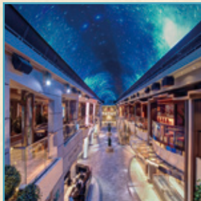
クルーズ船内イメージ