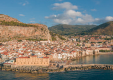
バレルモイメージ

*バルコニー付き上層階船室確約! *飲み放題プラン付き (イーゼードリンクパッケージ) *船内衛星Wi-Fiが 1デバイス無料でご利用可能