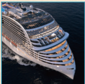
MSCエウロ号外観イメージ