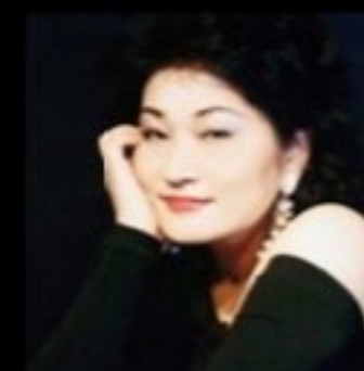
森山 京子(メゾ・ソプラノ)