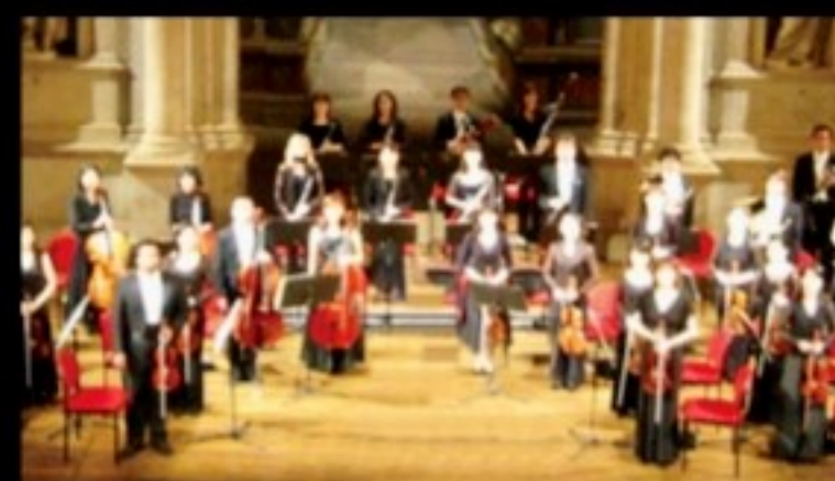
ロイヤルチェンバーオーケストラ

(合唱) 「混声合唱団」羽ばたく会、 富士山と第九を愛する会、 バチカンレクイエム合唱団