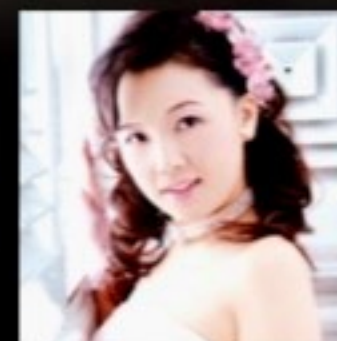
羽山 弘子(ソプラノ)