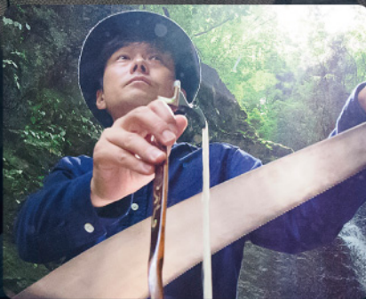
ミュージカル・ソー サキタハヂメ