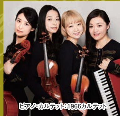
ピアノ・カルテット:1966カルテット